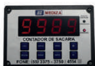
Contador de sacaria