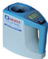
Medidor de umidade portátil Mu25