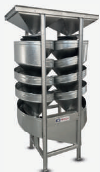
Classificador Helicoidal Espiral