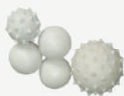
Esferas de borracha