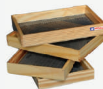
Peneira retangular 20x30cm