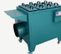
Secador de amostras