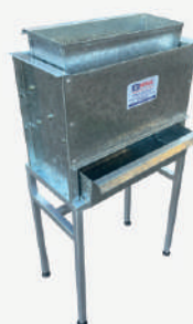
Quarteador com suporte de altura