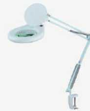
Lupa de mesa com iluminação