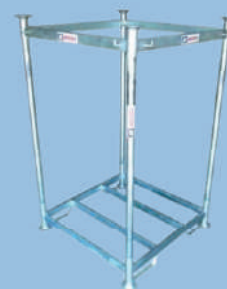
Suporte para armazenagem de big bag