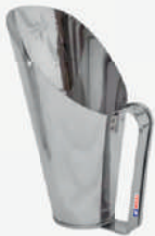
Caneca para sementes