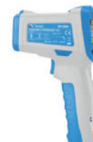
Termômetro infravermelho com mira laser