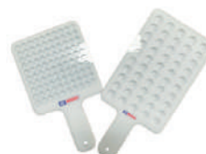
Placa contadora de sementes