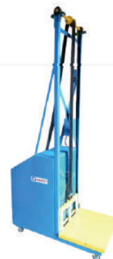
Elevador para sacos