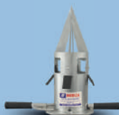
Dosador de bag tradicional