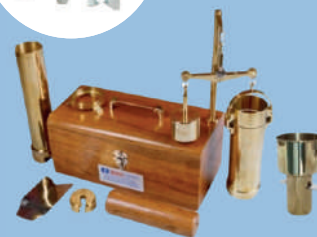
Balança para peso hectolítrico