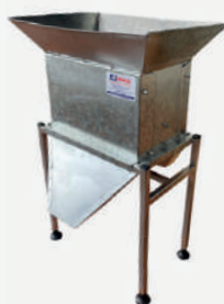
Quarteador com bocal