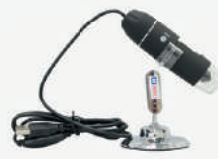
Lupa conexão USB