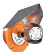
Controle de nível