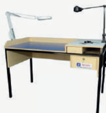
Mesa para classificação de grãos