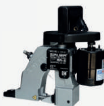
Máquina de costura portátil Siruba