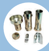
Kit para balança PH trigo