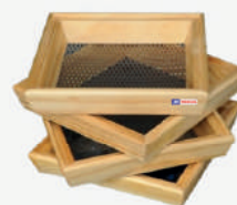
Peneira quadrada 20x20cm