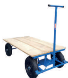
Carrinho plataforma de madeira