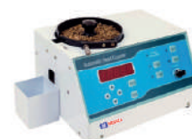
Contador de sementes digital