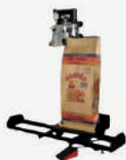
Costuradeira com carrinho