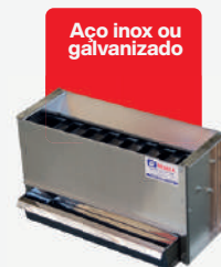
Quarteador de cereais