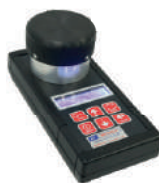
Medidor de umidade portátil Grain Check