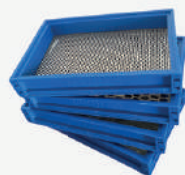
Peneira com borda plástica