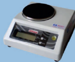
Balança digital UD1500