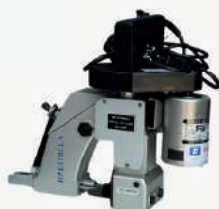
Máquina de costura portátil GK